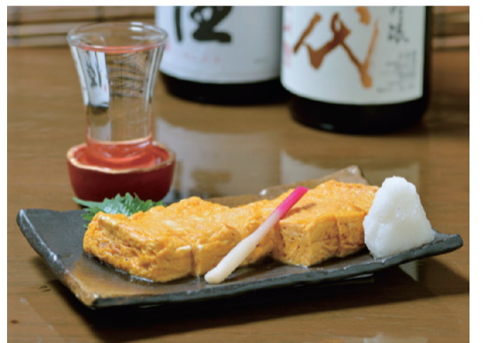
こだわりの玉子で作る自慢の「だしまき玉子焼き」(870円)