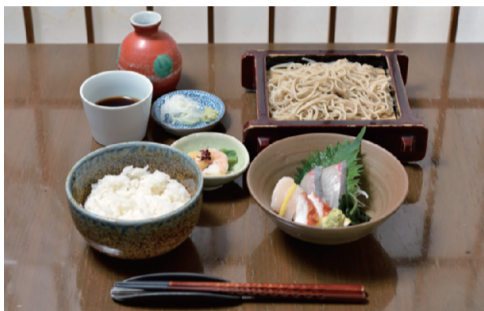
ランチメニューの「刺身御膳」(1,650円)。もりそば又はかけそば・刺身3点盛り・ご飯・小鉢・おしんこ付き。

「田舎もり」はコシがあり、かむほどに味わいが深まります。季節ごとに楽しめる「季節の」