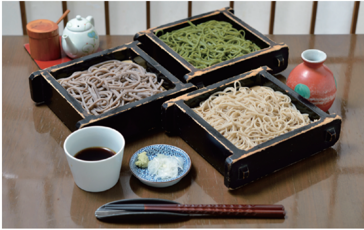
「三色もり」(1,300円)。上「季節の変わりそば 抹茶」、左「太打ち田舎もり」、右「細打ちせいろもり」。

たオーナーが都内でも有名な手打ちそばの店で修行を積み、地元の人においしいおそばを提供したいという思いから15年前に開いたお店。地下にある店内は外からは見え